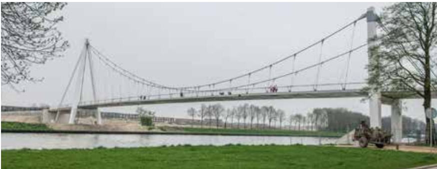
De Dafne Schippersbrug in Utrecht: een hangbrug

Als je naar hangbruggen in de echte wereld kijkt, dan zie je dat er meestal twee touwen gespannen worden waar een 'wegdek' aan wordt gehangen.