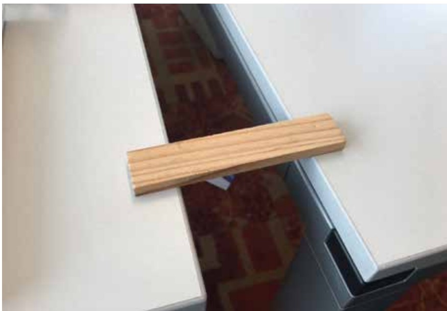
Materiaal heeft bepaalde handelingsmogelijkheden

Dat materiaal allerlei handelingsmogelijkheden heeft, wordt ook wel aangeduid met het Engelse begrip 'affordance' (Chemero, 2003). Dat betekent letterlijk 'toestaan'. Kapla staat je als het ware toe er een brug mee te bouwen. Het punt is dat je die 'affordantie' of handelingsmogelijkheid moet herkennen. Jonge kinderen zijn hier eigenlijk voortdurend mee bezig. Ze nemen de wereld om hen heen waar, en ze proberen voortdurend dingen uit met de voorwerpen in hun omgeving. Wat kan je ermee? Dit gedrag, waarnemen en doen, is erg belangrijk. Door te voelen, te kijken, te luisteren, door met al je zintuigen voorwerpen en verschijnselen te ervaren, kom je erachter wat je eraan hebt.