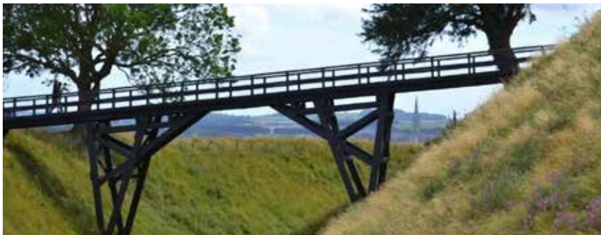
In dit voorbeeld trekken de pijlers meer aandacht dan in de brug in Londen