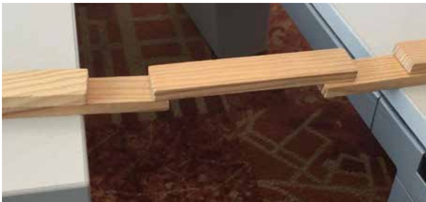
Een liggerbrug over een diep 'ravijn', met plankjes die als ligger of als tegenwicht dienen

moment nodig hebt. Door meer plankjes te gebruiken en verstandig te stapelen, kun je misschien wel aan de overkant komen. Je moet dan een andere handelingsmogelijkheid herkennen in het materiaal. Zoals in de afbeelding van de brug in Londen, kun je de ligger ook ondersteunen met pijlers. Je maakt dan gebruik van de handelingsmogelijkheid dat je Kapla goed kunt stapelen.