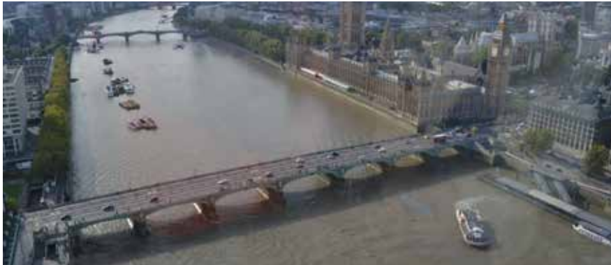
Een 'liggerbrug' in Londen over een ondiepe rivier, ondersteund met pijlers