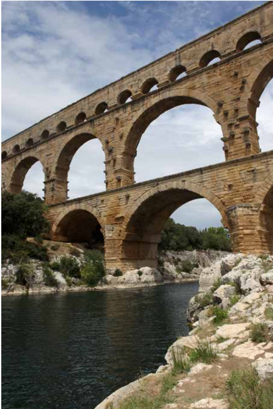
De 'Pont du Gard': een Romeinse boogbrug met wigvormige stenen

Nu is er nog een mooi brugtype dat iedereen wel kent: de boogbrug. Ken je daar een mooi voorbeeld van? Denk eens na over het materiaal dat hiervoor nodig is. Heb jij dat voorradig op school of kinderdagverblijf? Probeer maar eens een boogbrug te maken van Kapla: dat is lastig. Rechthoekig materiaal mist namelijk de handelmogelijkheid om een ronding te maken. En dat is nodig voor een boogbrug.